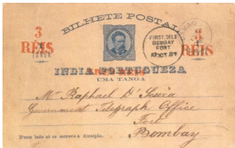
Figura 3 (73% da largura e altura originais)