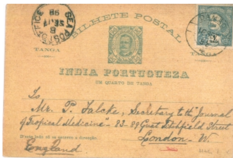
Figura 9 (73% da largura e altura originais)