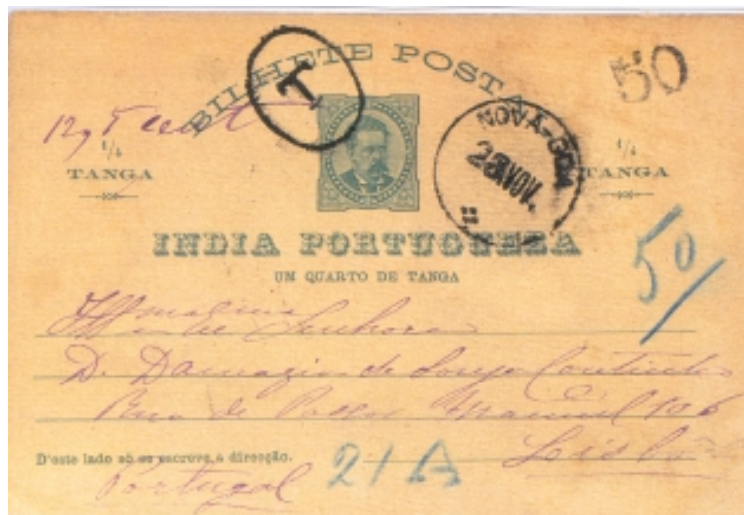
Figura 8 (73% da largura e altura originais)