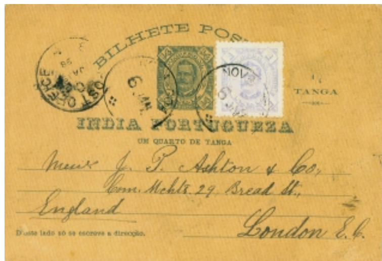
Figura 10a & 10b (72% da largura e altura originais em 10a 74% da largura e altura originais em 10b)