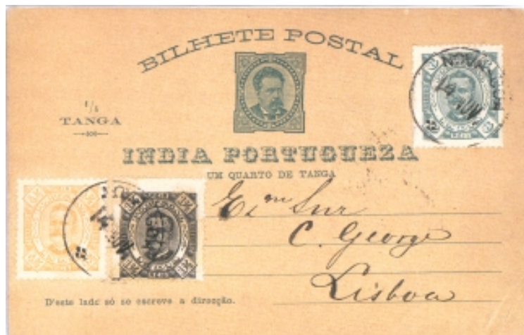
Figura 7b (73% da largura e altura originais)

A quantidade recebida nos dois primeiros envios da metrópole, e que foi de 60.000 da taxa de 3 réis e 35.000 da taxa de 1 tanga era manifestamente insufficiente e desajustada, pois que como vimos não chegaria nem para o consumo de um ano no que respeita ao bilhete de 3 réis