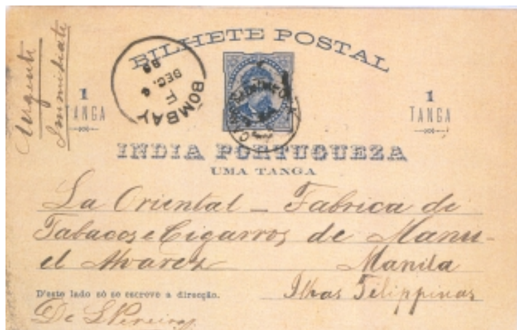
Figura 4a & 4b (75% da largura e altura originais)