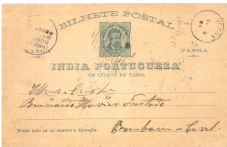
Figura 2 (73% da largura e altura originais)