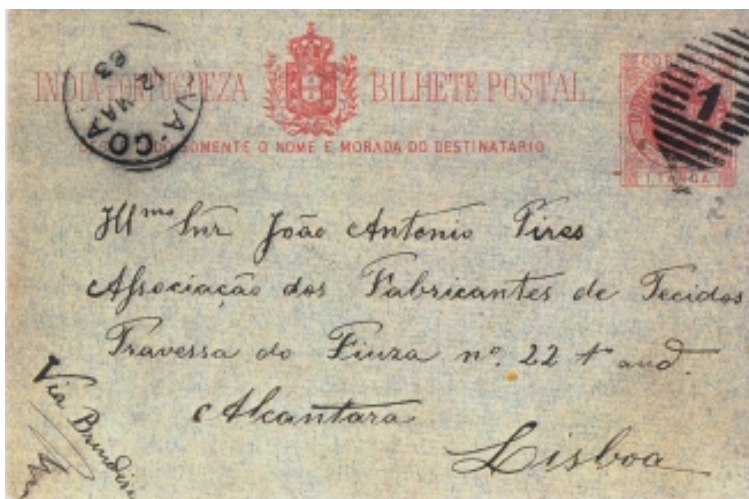
Figura 1a & 1b (75% da largura e altura originais em 1a 72% da largura e altura originais em 1b)