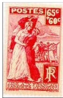
Fig. 6. Ajuda para os franceses repatriados de Espanha (1938). A filatelia presente nos grandes acontecimentos históricos.

genda ( Pour sauver la race ) que nos deixa de certo modo intrigado quanto ao seu objectivo real. (Fig. 5), e em 1938 emite um