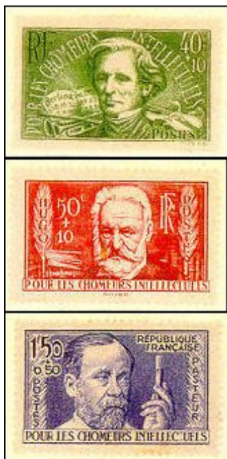
Fig. 4. Série dedicada aos intelectuais desempregados.

Filatelicamente porém, consideramos sobretudo os selos postais autênticos, a cujo valor facial se acrescentou uma sobretaxa reservada para vários fins.