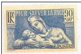
Fig. 5. Para salvar a raça. Assistência à criança com ajuda filatélica.

Aliás a França utilizou exaustivamente esse recurso à via postal (diria filatélica) através de séries contemplando, por exemplo, os intelectuais desempregados, em séries normalmente muito belas, e ilustradas com os grandes vultos da sua cultura e não só. (Fig. 4) Em 1937 emite um selo com a le-