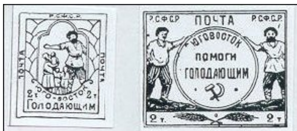
Fig. 2. Expressão dramática de uma situação de crise sob compromisso filatélico.

Precisaremos neste ponto que se consideram autênticos selos de beneficência, aqueles que, sem possuírem qualquer valor postal, se acrescentam por determinadas ocasiões ou em determinados períodos, aos valores faciais do selo, e cujo montante total reverte a favor da obra proposta.