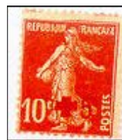
Fig. 3 Sobretaxa para a Cruz Vermelha

Filatelicamente porém, consideramos sobretudo os selos postais autênticos, a cujo valor facial se acrescentou uma sobretaxa reservada para vários fins.